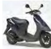
アドレスV50(CA1FA/1FB) Let's(CA1KA) / Let's2