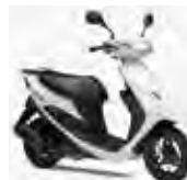
アドレスV50(CA42A/44A/4BA) Let's(CA4AA) / Let's4 / Let's5